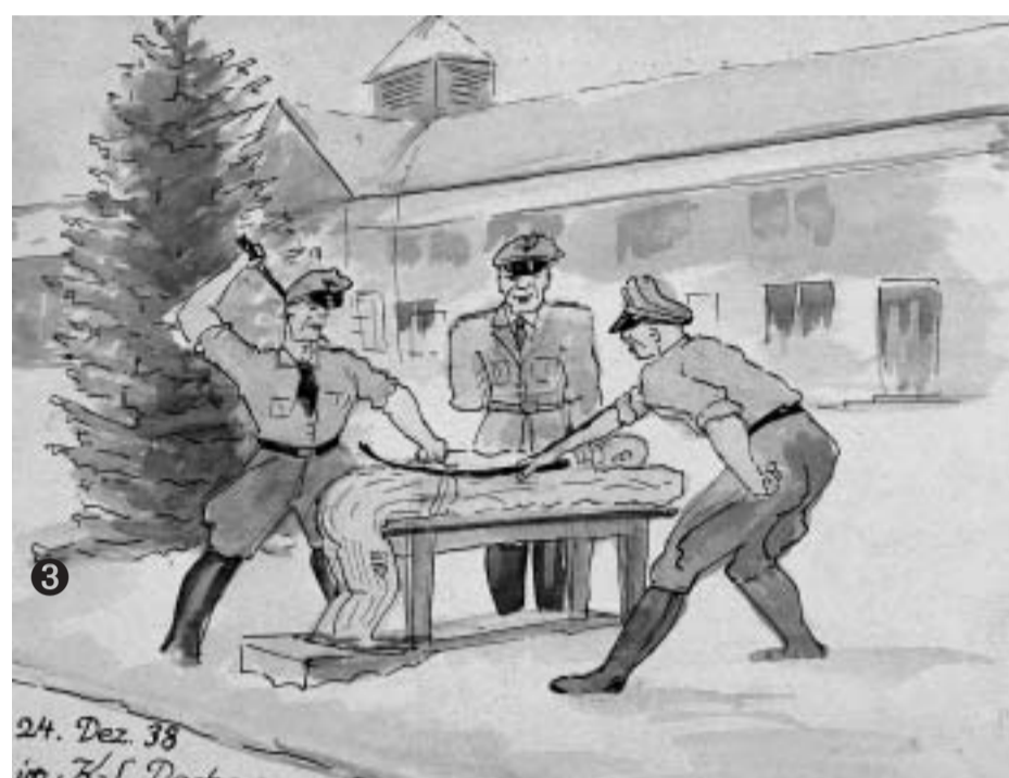
Prügelstrafe im KZ Dachau 1938 Corporal punishment in the camp 1938 Grafik: Albert Kerner 1945/46 (bis 1945 Häftling im KZ Dachau)

The SS deployed in the camp reached the actual concentration camp area through the main guard post, which was separated by a wall from the SS drill camp in 1936.