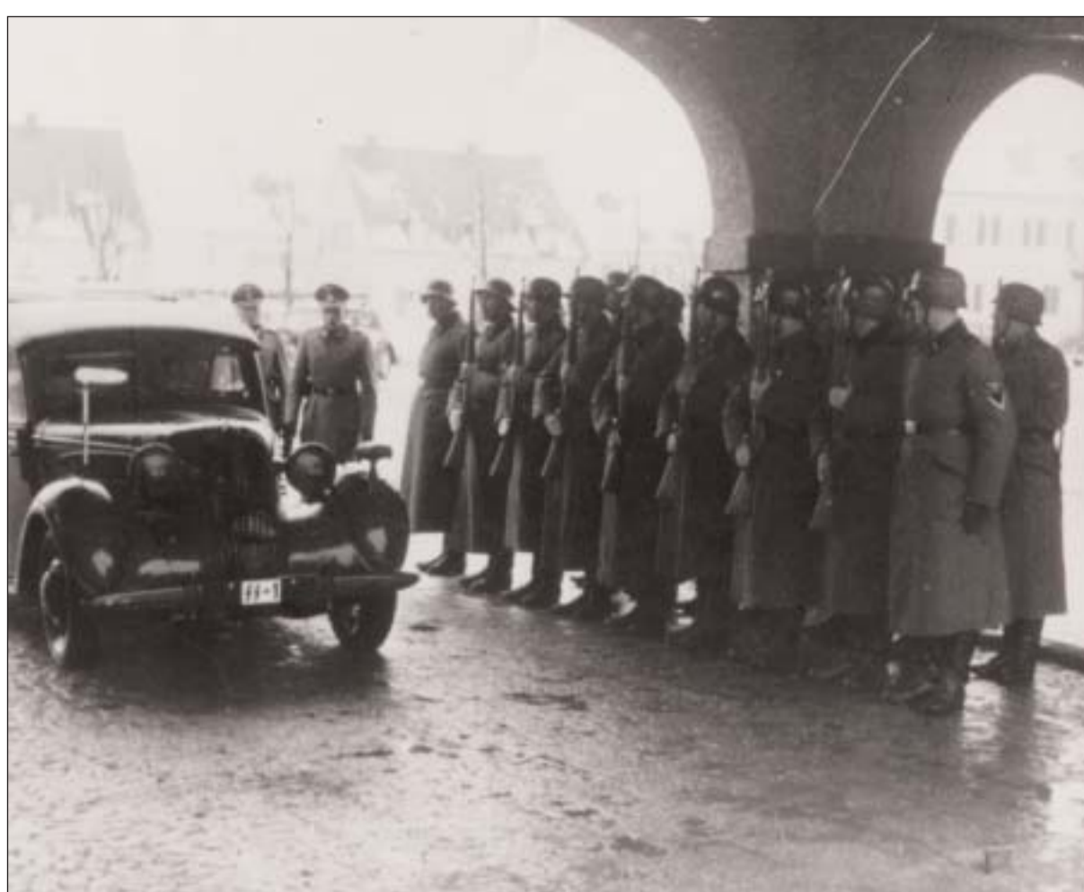
Himmlers Wagen an der Hauptwache des KZ Dachau Himmler's car passes the main guard post of the Dachau camp Foto: SS 1941, KZ-Gedenkstätte Dachau