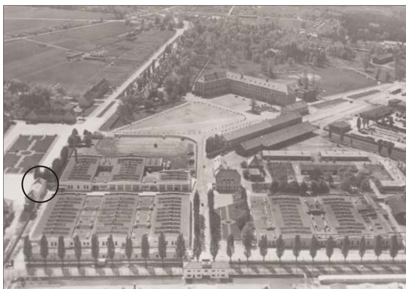
SS-Bereich des KZ Dachau mit Hauptwache The SS area of the Dachau concentration camp with the main guard post

Über die Hauptwache erreichte die im KZ-Dienst eingesetzte Lager-SS den eigentlichen KZ-Bereich, der seit 1936 durch eine Mauer vom SS-Übungslager abgetrennt war.